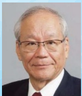
横倉義武共同代表