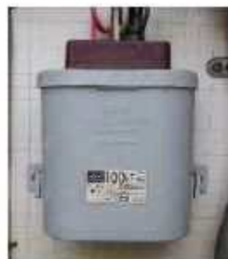
小型コンデンサー